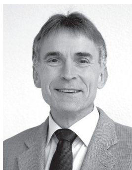
Günther Bubenitschek, Erster Kriminalhauptkommissar, Opferschutzkoordinator, Polizeidirektion Heidelberg/Polizeipräsidium Mannheim